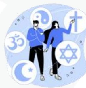
sua preferência religiosa

Agora fica fácil você compreender que o uso mal intencionado desses dados pode criar muitos problemas, como ocorre com os conhecidos golpes de boletos bancários, fraudes em contas de aplicativos, abertura indevida de contas bancárias e de consumo.